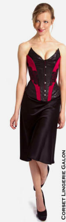
CORSET LINGERIE GALON REF. E11-07-12-GALON ROBE FINES BRETILLES REF. E11-05-05