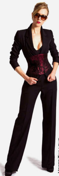
VESTE TAILLEUR REF. E11-01-01 SERRE-TAILLE BROCARD DENTELLE REF. E11-08-08-DENTELLE PANTALON TAILLEUR REF. E11-03-01