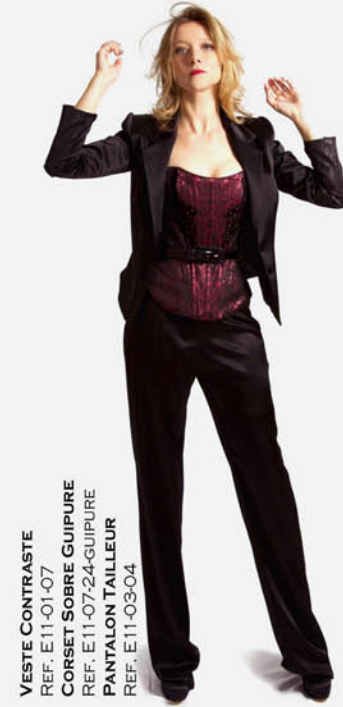
VESTE CONTRASTE REF. E11-01-07 CORSET SOBRE GUIPURE REF. E11-07-24-GUIPURE PANTALON TAILLEUR REF. E11-03-04