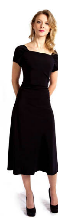
ROBE MANCHES REF. E11-08-19