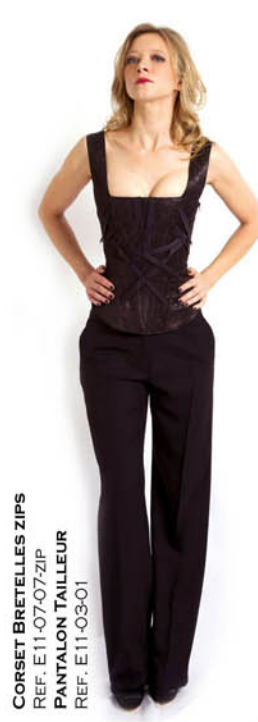
CORSET BRETILLES ZIPS REF. E11-07-07-ZIP PANTALON TAILLEUR REF. E11-03-01