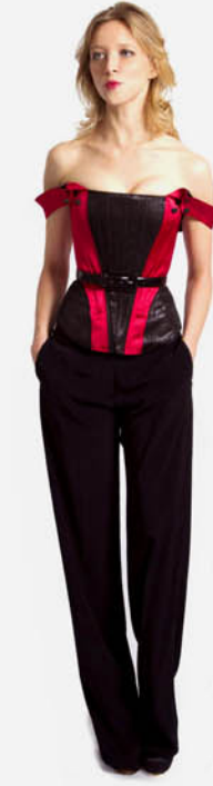
CORSET BRETILLES BOUTONS REF. E11-07-06-BOUTON PANTALON TAILLEUR REF. E11-03-03