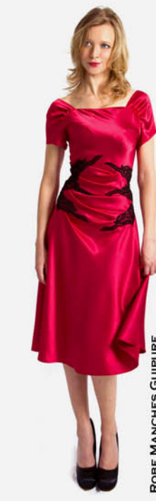
ROBE MANCHES GUIPURE REF. E11-05-22-GUIPURE