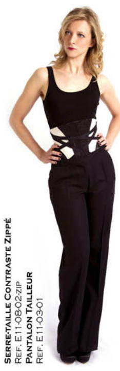
SERRE-TAILLE CONTRASTE ZIPPÉ REF. E11-08-02-ZIP PANTALON TAILLEUR REF. E11-03-01