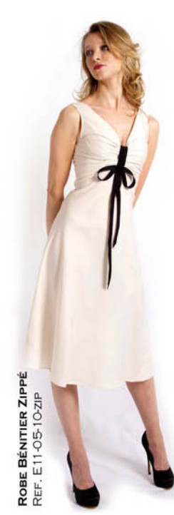
ROBE BÉNITIÈRE ZIPPÉ REF. E11-05-10-ZIP