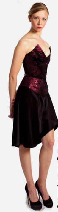
CORSET LINGERIE DENTELLE REF. E11-07-16-DENTELLE ROBE FINES BRETILLES REF. E11-05-05