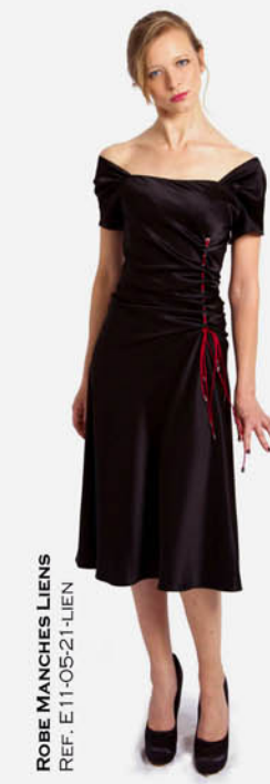
ROBE MANCHES LIENS REF. E11-05-21-LIEN