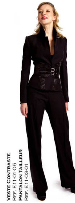
VESTE CONTRASTE REF. E11-01-05 PANTALON TAILLEUR REF. E11-03-01