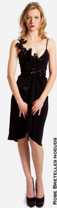
ROBE BRETILLES NOEUDS REF. E11-05-03-NOEUD