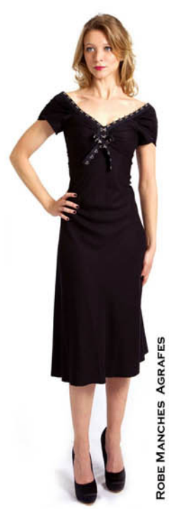
ROBE MANCHES AGRAFES REF. E11-05-17-AGRAFE