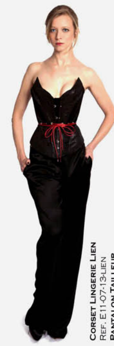
CORSET LINGERIE LIEN REF. E11-07-13-LIEN PANTALON TAILLEUR REF. E11-03-04