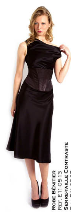
ROBE BÉNITIÈRE REF. E11-05-13 SERRE-TAILLE CONTRASTE REF. E11-08-05