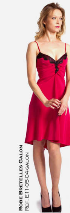
ROBE BRETILLES GALON REF. E11-05-04-GALON