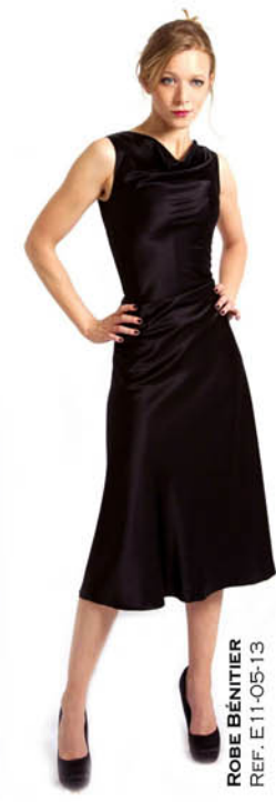
ROBE BÉNITIÈRE REF. E11-05-13