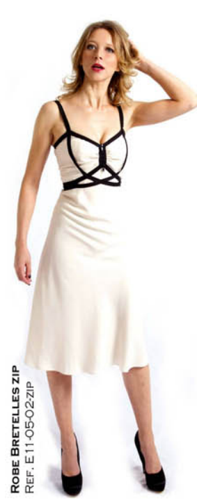
ROBE BRETILLES ZIP REF. E11-05-02-ZIP