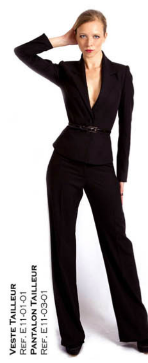
VESTE TAILLEUR REF. E11-01-01 PANTALON TAILLEUR REF. E11-03-01