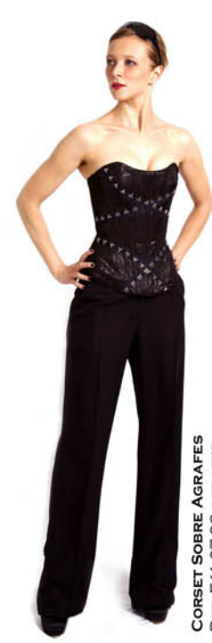
CORSET SOBRE AGRAFES REF. E11-07-23-AGRAFES PANTALON TAILLEUR REF. E11-03-01