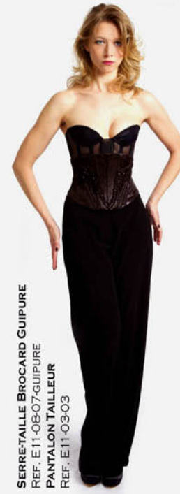
SERRE-TAILLE BROCARD GUIPURE REF. E11-08-07-GUIPURE PANTALON TAILLEUR REF. E11-03-03