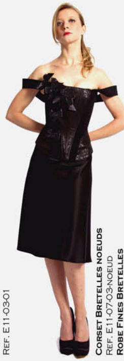
CORSET BRETILLES NOEUDS REF. E11-07-03-NOEUD ROBE FINES BRETILLES REF. E11-05-03