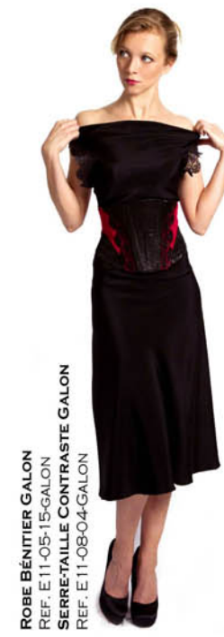
ROBE BÉNITIÈRE GALON REF. E11-05-15-GALON SERRE-TAILLE CONTRASTE GALON REF. E11-08-04-GALON