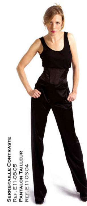
SERRE-TAILLE CONTRASTE REF. E11-08-05 PANTALON TAILLEUR REF. E11-03-04