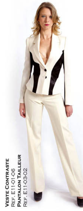
VESTE CONTRASTE REF. E11-01-06 PANTALON TAILLEUR REF. E11-03-02