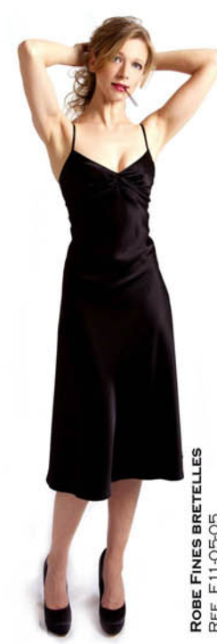
ROBE FINES BRETILLES REF. E11-05-05