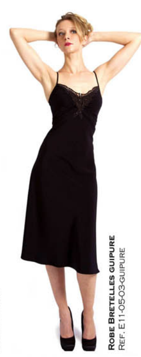
ROBE BRETILLES GUIPURE REF. E11-05-03-GUIPURE