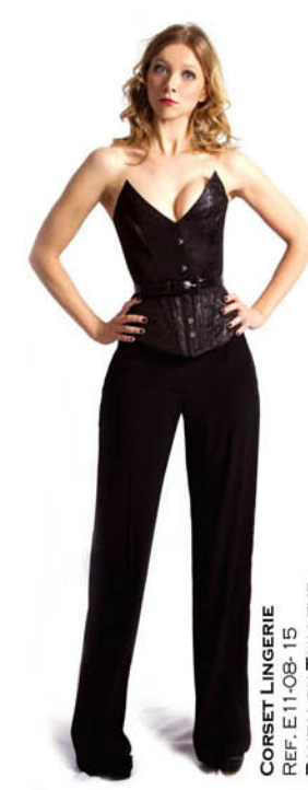
CORSET LINGERIE REF. E11-08-15 PANTALON TAILLEUR REF. E11-03-03