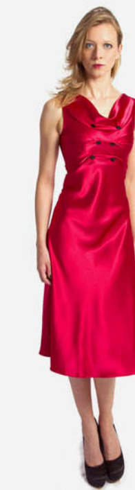
ROBE BÉNITIÈRE BOUTONS REF. E11-05-14-BOUTON